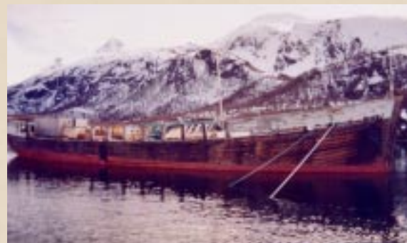
Skroget ved fiskeoppdrettet i Blokken. (Foto Arnold Jensen).