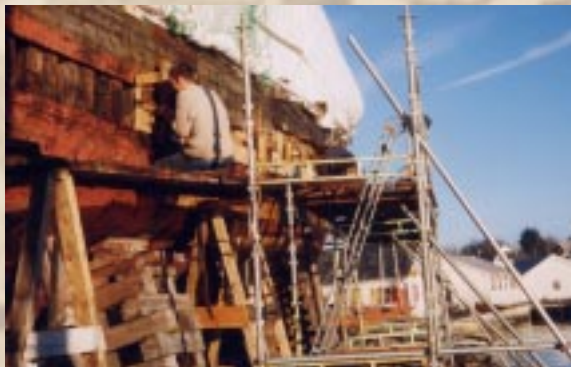
Bergeland videregående skole sørget for stillaser.