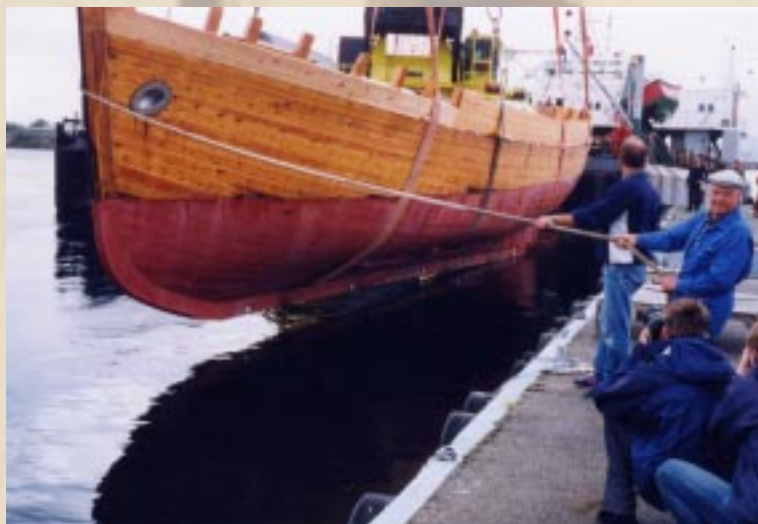
Under sjøsettingen. Skroget styres tilbake til sitt rette element.

De som vil lese mer om dette unike prosjektet kan lese boken om M/K "Andholmen" i krig og fred. Telefonbestilling: 51860237, fax 51860217 og email: sv-c-siv@online.no