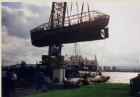
Det ble et høyt løft.