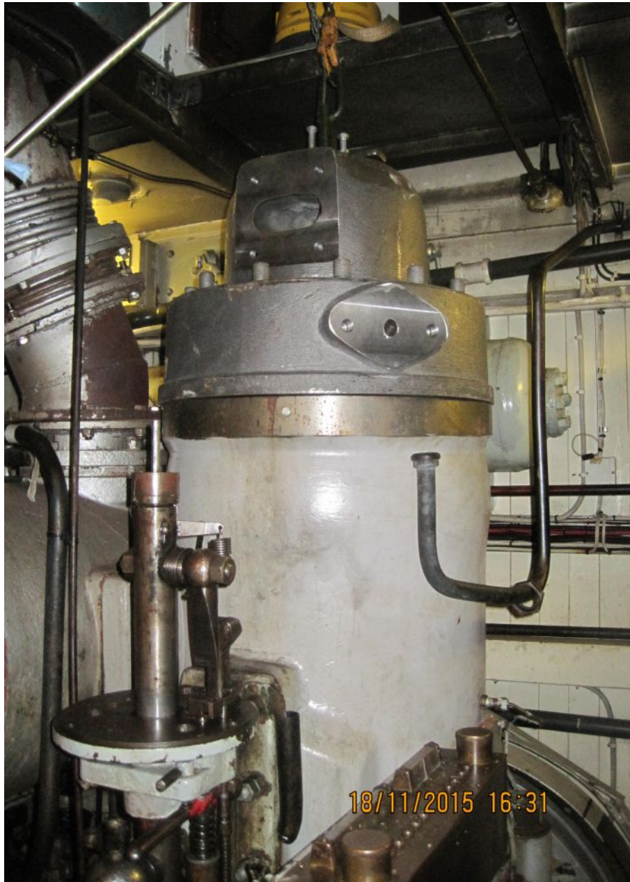
Ny sylinder med ny topp er kommet på plass i maskinrommet!