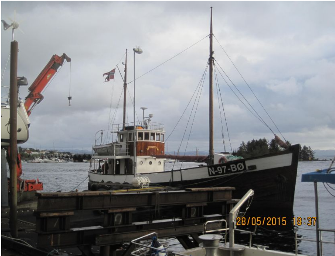
«Andholmen» klar for slippsetting ved Tau Slipp og Båtbyggeri.

Lørdag 31. Mai: Sjøsetting og retur til Ulsnes.