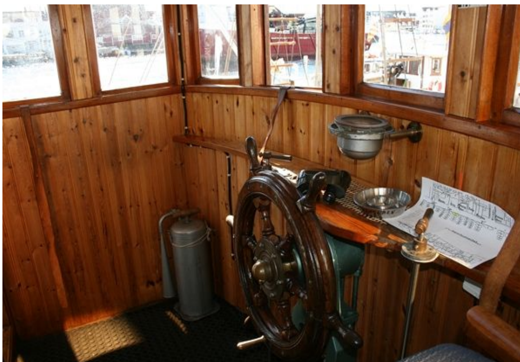
Interiorbilde fra M/K«Andholmen»s styrehus.