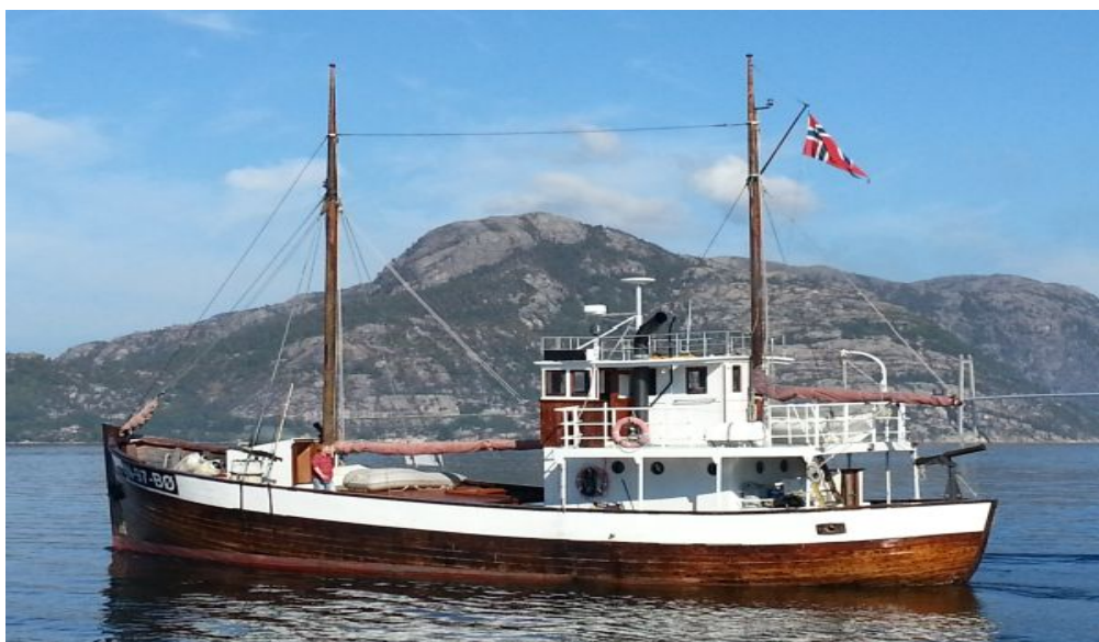
M/K «Andholmen» i Høgsfjord, Rogaland.