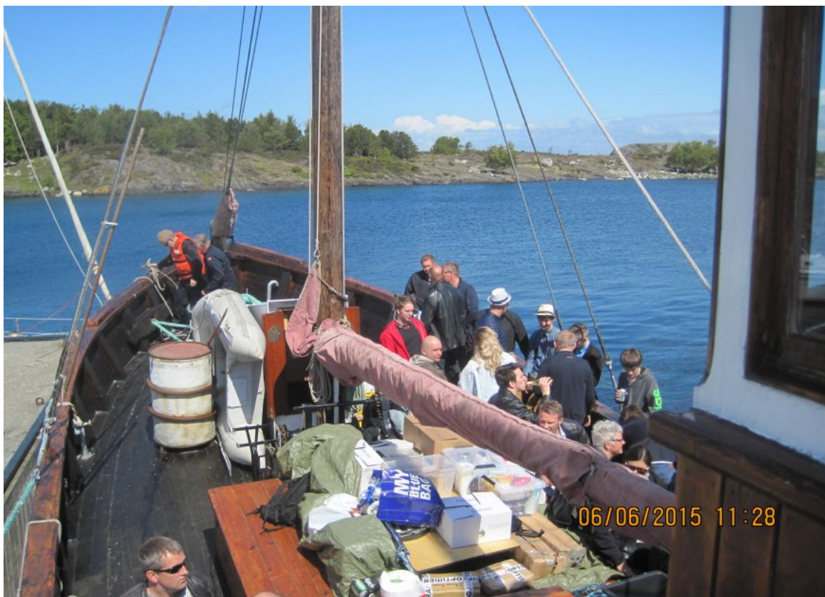
«Andholmen» med gjester fra Optimera legger til kai på Langøy.

Kl. 1300: Fortøyde Langøy. Gjestene gikk i land.