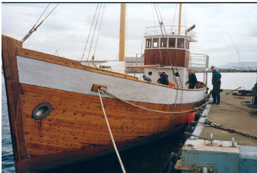
Mastene er kommet på plass og dugnadsgjengen er i full sving med klargjøringsarbeider langs kai på Ulsnes, April 2002.

Perioden fra nyttår til mai 2002 ble en ekstra travel tid for Stiftelsen M/K Andholmen. Skroget var sjøsatt 30. juli 2001. Høsten det samme året gikk med installasjon av motor med tilhørende systemer samt ombordløfting og montering av dekkshus, styrehus og kappe forut. Alle detaljene med innredning, køyer, lugarer, master og mye annet tok lengre tid en vi regnet med. Fagmannen som skulle installere elektrisitet ble syk, noe som resulterte i at alt måtte settes bort til vanlig regning og tok langt lengre tid enn planlagt. Det gjorde også mye annet arbeid våren 2002.