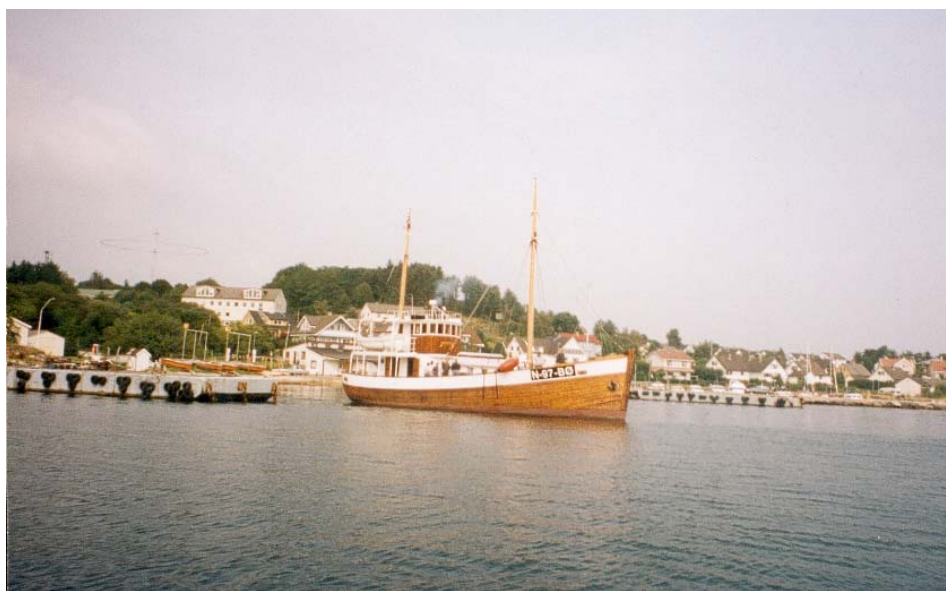
Avgang Ulsnes 16. August 2002 med ”Havnedagene” i Haugesund som mål.

Resten av Juli tok mange i dugnadsgjengen ferie. I August var fartøyet klart og Mandag 12. seilte ”Andholmen” lokalt til øya Bru nord for Stavanger med 32 lærere fra Lunde skole på Hundvåg som ble orientert om fartøyet og dets historie underveis. I perioden 16.-18. August deltok fartøyet og 11 mann i det alltid godt besøkte arrangementet ”Havnedagene” i Haugesund. Den turen gikk fint. Boken ” Andholmen i krig og fred ” var også ferdig da og ble sammen med fartøyets krus solgt om bord og på kaien. Mange sikret seg både omvisning, bok og suvenir. Så vidt vites fikk fartøyet ingen pressedekning.